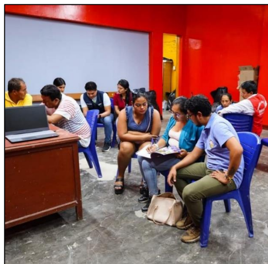
Capacitación sobre actualización del inventario de recursos turísticos – Dircetur.