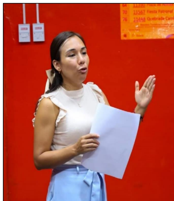
Funcionaria Mincetur: taller de capacitación sobre actualización del inventario Dircetur 2023