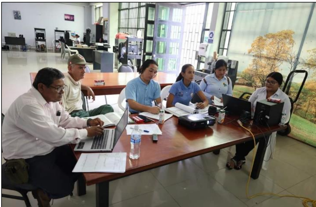
Equipo técnico de actualización de inventario en trabajo de gabinete; etapa de Jerarquización – 2023.