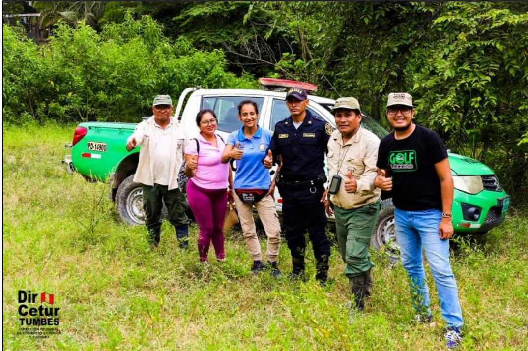
Equipo técnico de actualización de inventario en trabajo de campo; etapa de categorización – 2023.